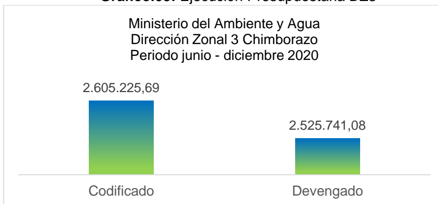
Gráfico.03: Ejecución Presupuestaria DZ3