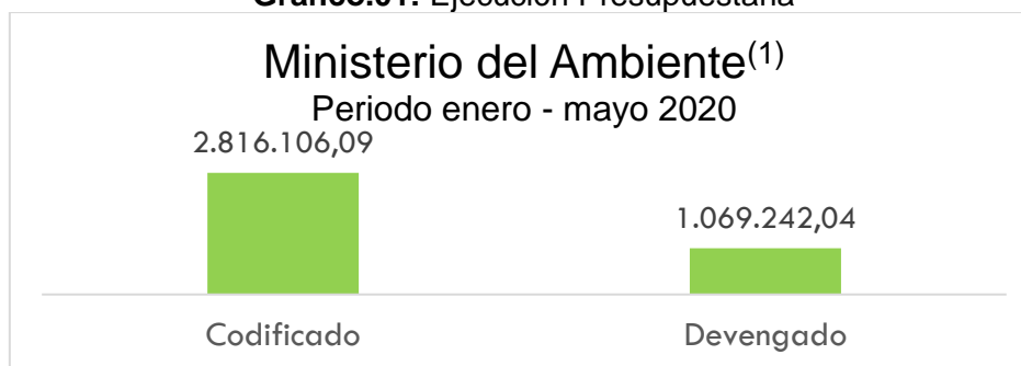
Gráfico.01: Ejecución Presupuestaria